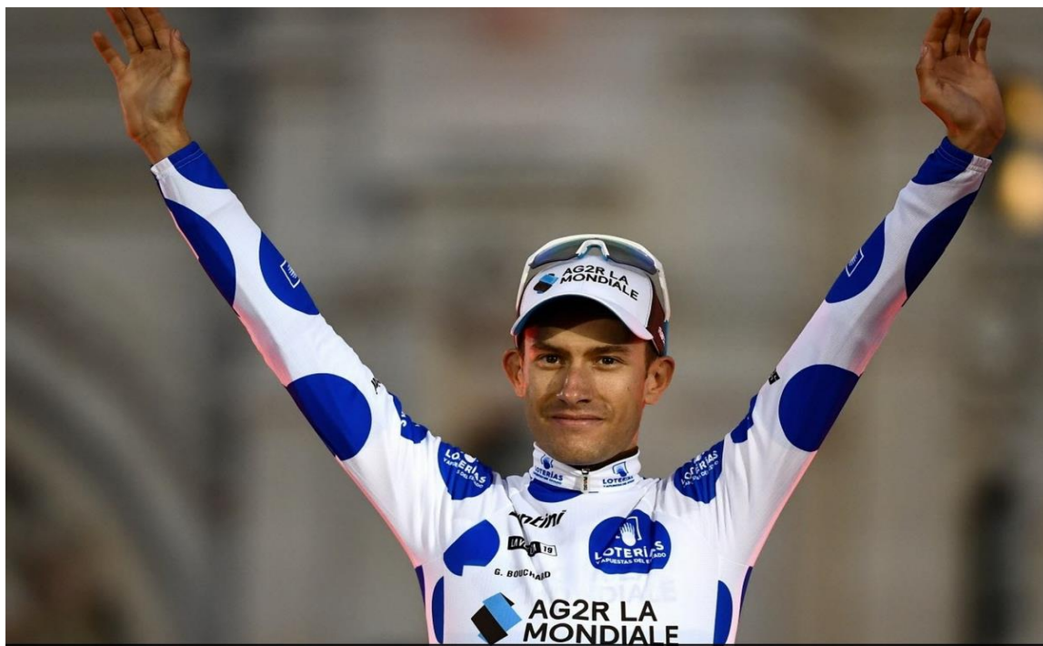
Vainqueur du Tour de Moselle 2018, Geoffrey Bouchard vient de s'illustrer sur la Vuelta. À Madrid, il a été couronné meilleur grimpeur de l'épreuve.

La 34e édition du Tour de Moselle s'élance ce vendredi d'Évrange. L'épreuve, qui a révélé les plus grands, regorge de futures pépites du peloton professionnel. Les Lorrains espèrent faire bonne figure.